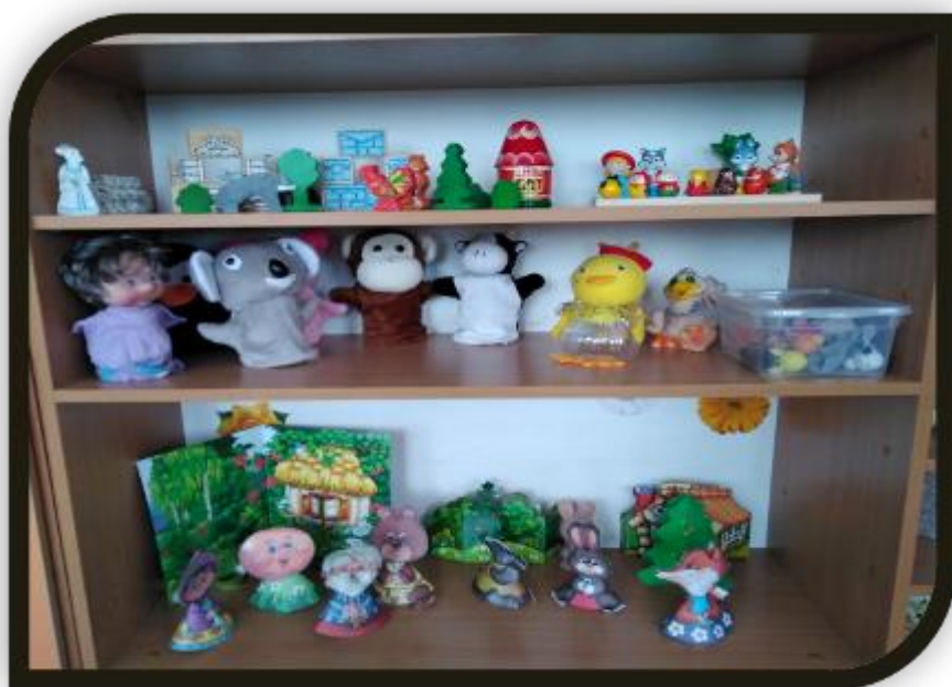
Магнитный и деревянный театр.