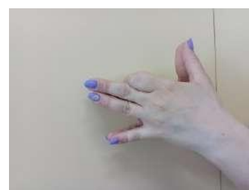
Лисичка - пальчиковое упражнение «Лиса»;