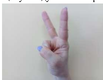
Зайчик - пальчиковое упражнение «Зайчик»;