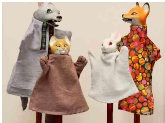
Куклы на галите

- настольный кукольный театр (театр на плоской картинке, театр на кружках, магнитный настольный, конусный, театр игрушки);