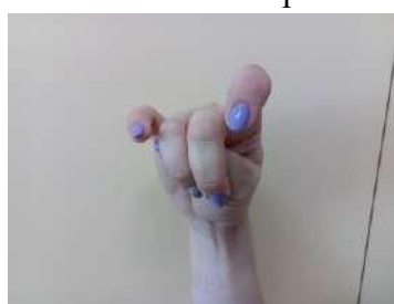
Лягушка - пальчиковое упражнение «Лягушка»;