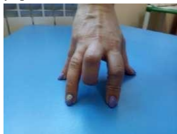
Медведь - пальчиковое упражнение «Медведь»;